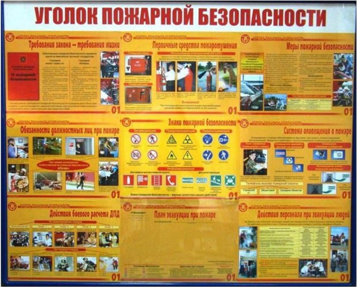
Рис. 3. Пример оформления уголка пожарной безопасности

http://sibou.ru/ , sib-ou@mail.ru , 8(3852) 57-20-64, +7(929) 397-20-64