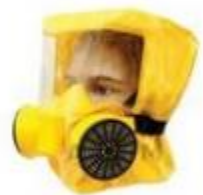
Средства индивидуальной защиты