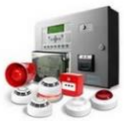
Элементы систем противопожарной защиты зданий и сооружений

в классе пожарной безопасности могут быть размещены: