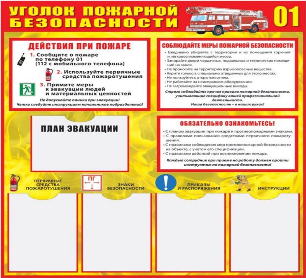
Рис. 2. Пример оформления уголка пожарной безопасности

http://sibou.ru/ , sib-ou@mail.ru , 8(3852) 57-20-64, +7(929) 397-20-64