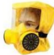
Средства индивидуальной защиты