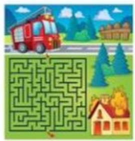
Дидактические материалы, связанные с пожарной тематикой