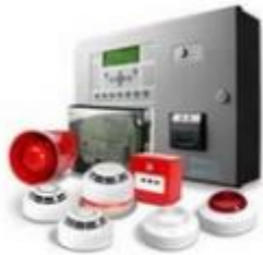
Элементы систем противопожарной защиты зданий и сооружений

в классе пожарной безопасности могут быть размещены: