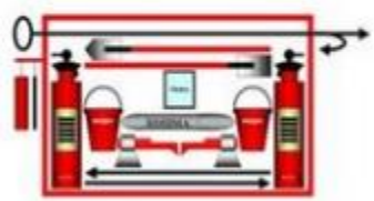
Первичные средства пожаротушения