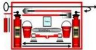
Первичные средства пожаротушения